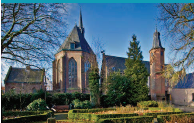
Catharinakapel met Linnaeustorentje.

Veel van die bronnen zijn in het Latijn. Daarbij krijgen wij hulp van het Trefpunt Medische Geschiedenis Nederland in Urk. Naast de faculteiten Recht en Theologie was de medische faculteit heel belangrijk, met aansprekende professoren en beroemde studenten en promovendi. Het Trefpunt is