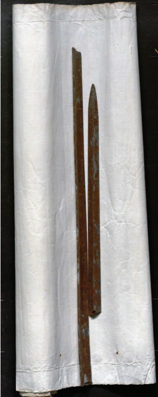
Degenresten, aangevoerd als bewijs, 1768-1769.

onderzoek naar het verleden, dat wil zeggen de archieven, zal op zijn vroegst in het najaar starten.